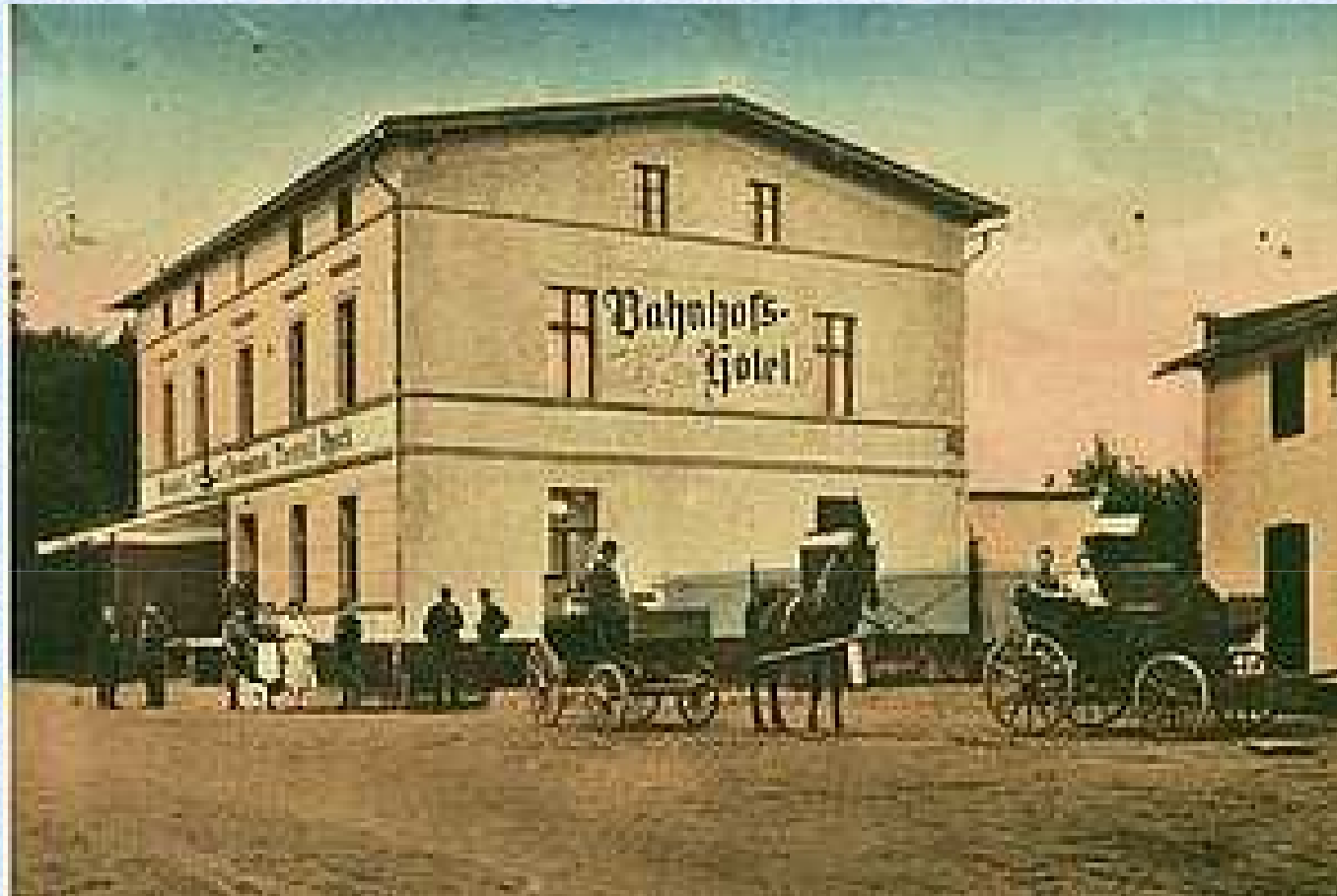
Dawny hotel Theobalda Puscha