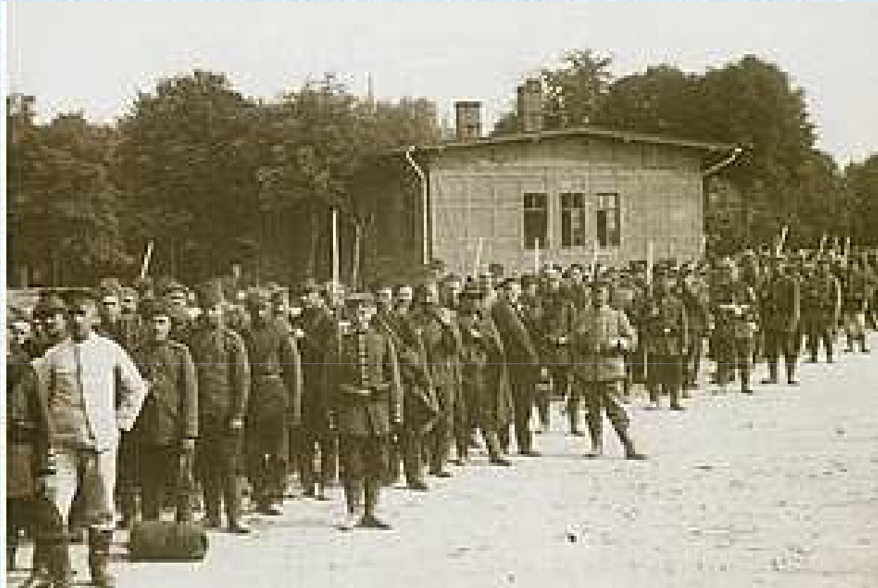
Budynek poczty garnizonowej