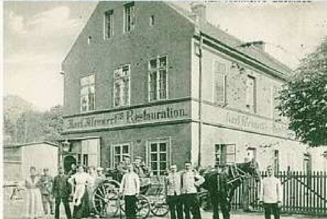
Dawna restauracja Karla Klennerta