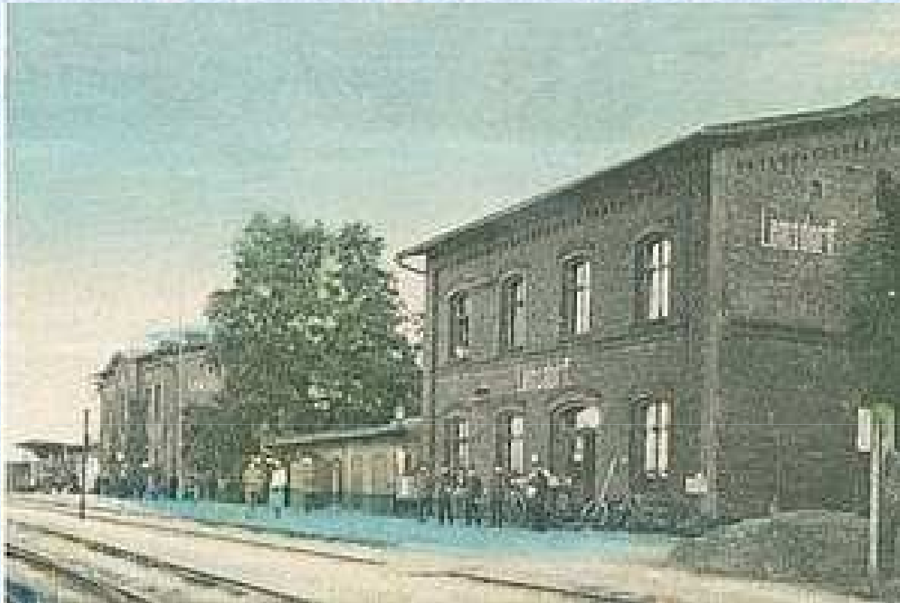
Stacja kolejowa w Łambinowicach