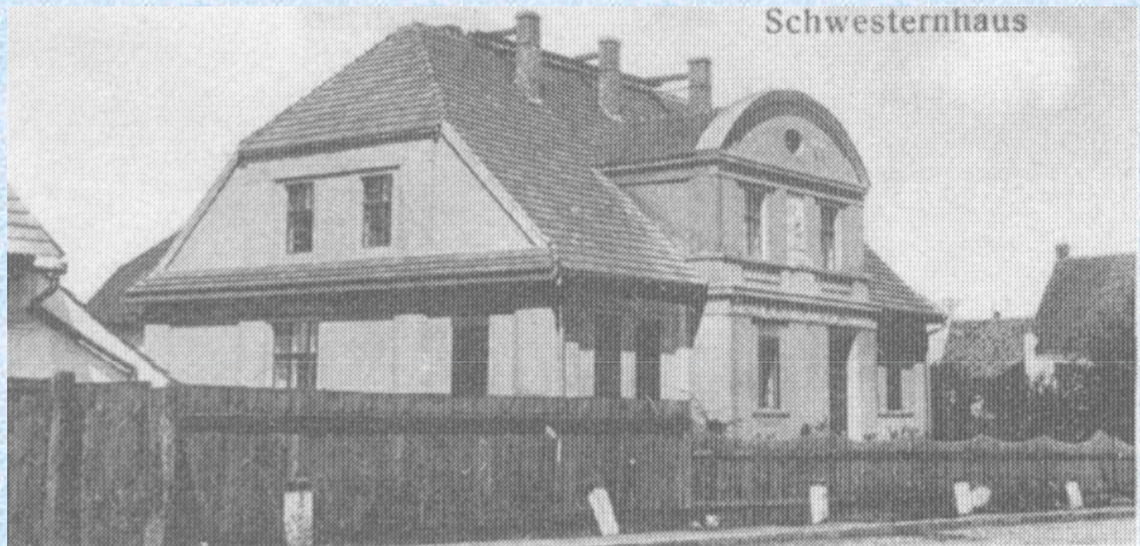
Dom sióstr zakonnych