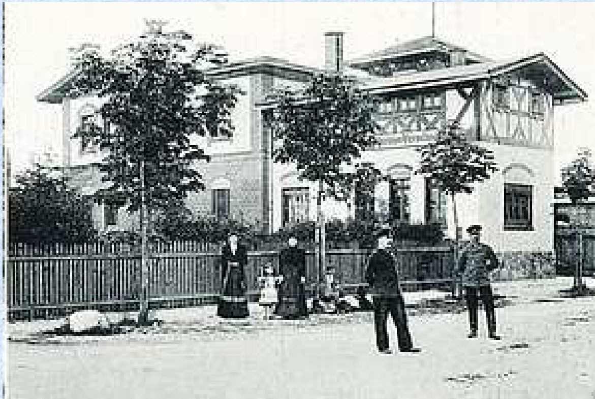
Budynek administracji garnizonowanej