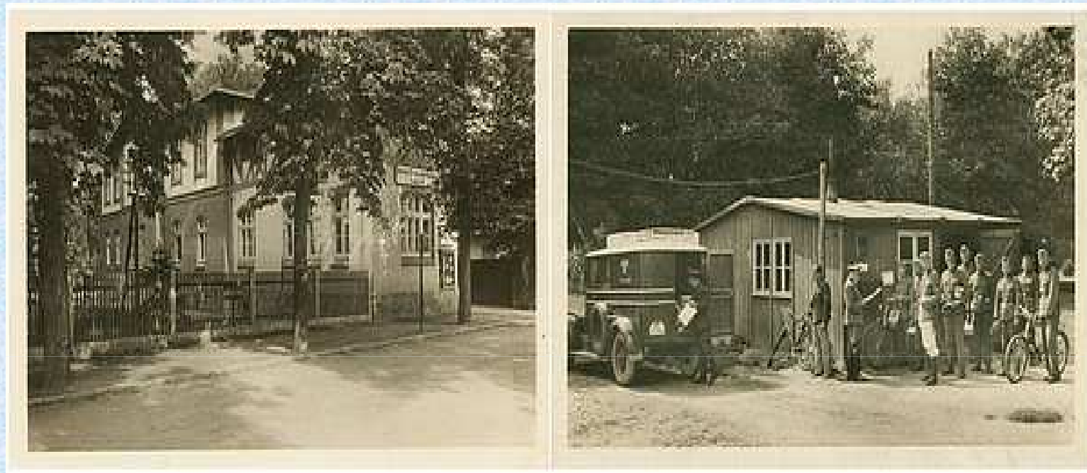
Budynek Wojskowej Komendy Uzupełnień przy Lager I i placówka poczty polowej - 1939 r.