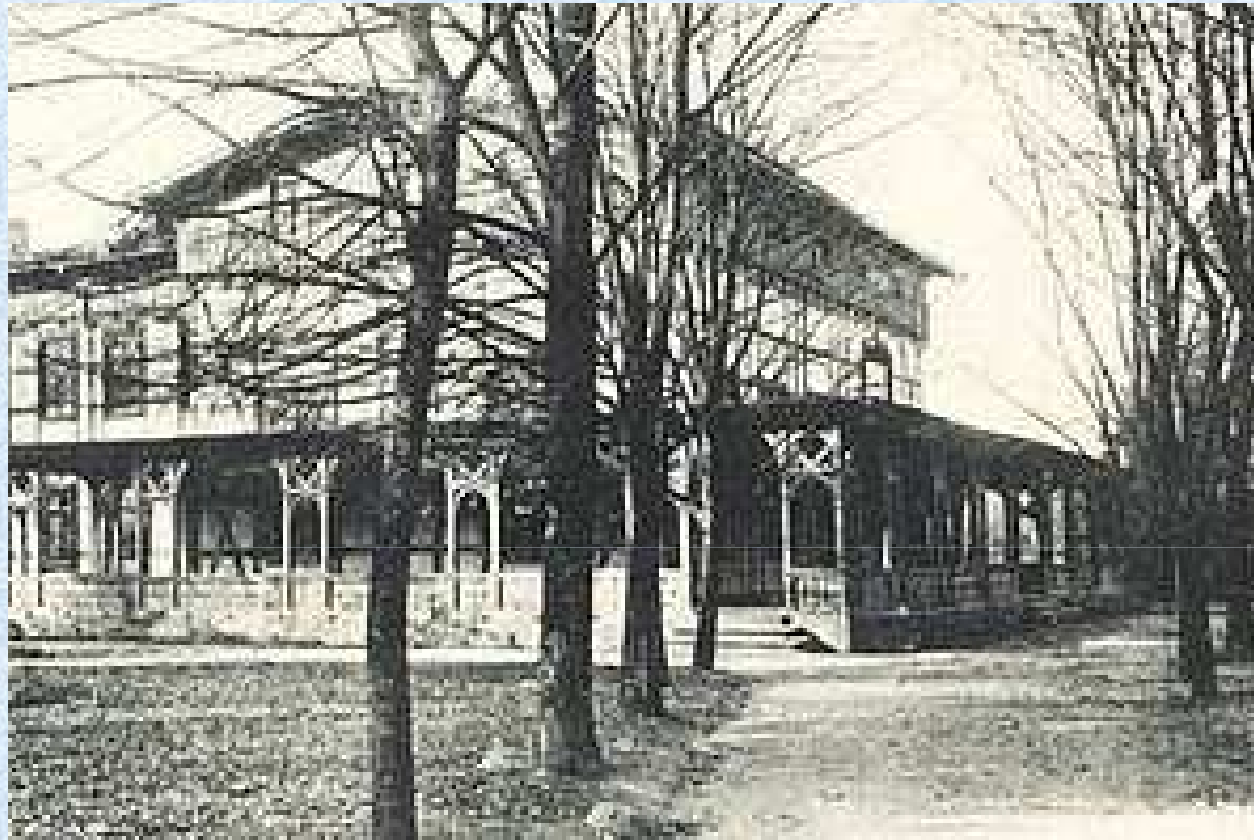
Kasyno oficerskie na terenie Lager I